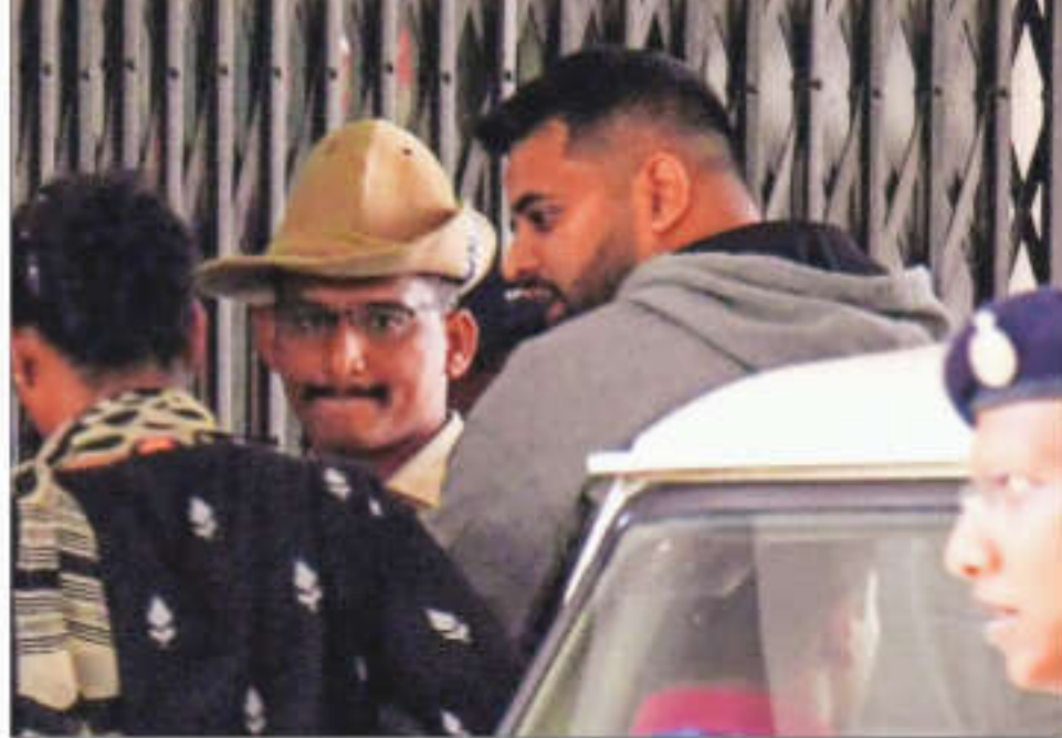
Suspended JD(S) MP Prajwal Revanna being taken to the hospital for medical examination, in Bengaluru on Friday

Prajwal (33), the JD(S) MP from Hassan, was taken into custody from Bengaluru International Airport after he arrived from Munich in the early hours of Friday. He had left the country on April 27 — a day after his Lok Sabha constituency went to the polls — as objectionable videos showing sexual assault, allegedly involving him, started being circulated in the public domain.